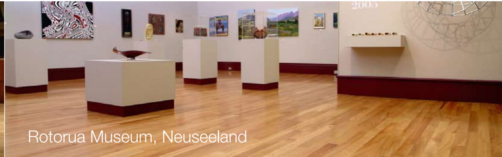
Rotorua Museum, Neuseeland