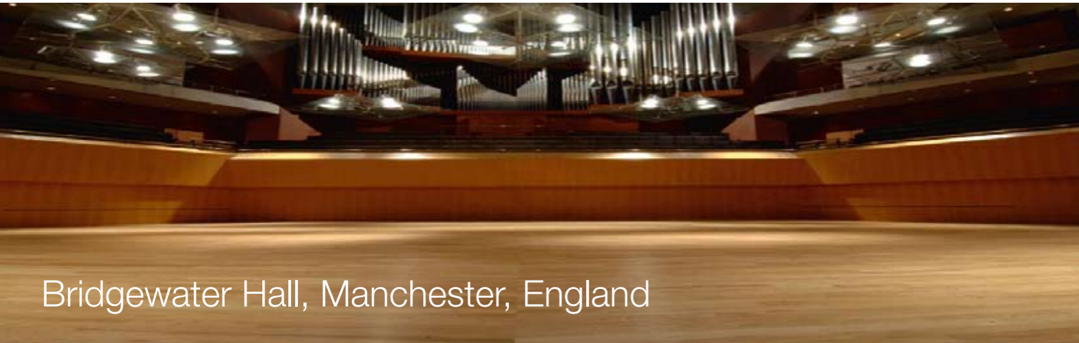
Bridgewater Hall, Manchester, England